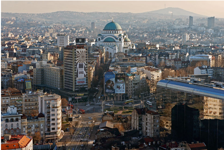
Слика 2. Београд (главни град Србије)

Србија је подунавска земља. Дунав кроз Србију протиче или је додирује на дужини од 588,6 km и Србији отвара пут на Северно и Црно море. Кроз Босфори Дарданеле овај пут води у Егејско, односно Средоземно море. На Дунаву лежи Београд главни град Србије.