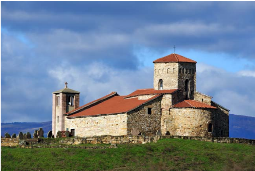
Слика 6. Петрова црква

Најпознатије грађевине из раздобља 8 – 12.века јесу : Петрова црква код Новог Пазара ( или црква апостола Петра и Павла), која представља најстарији споменик црквене архитектуре. Од посебног значаја су остаци утврђених градова у Долини Дунава: Петроварадин, Калемегдан, Смедерево, Рам, Голубац итд. У долини Јужне Мораве је Корвин град, познати Соко – град у близини Сокобање.