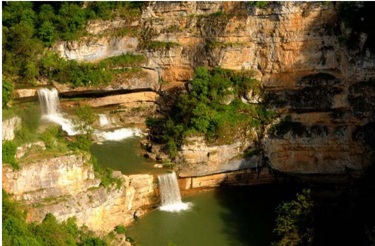
Слика 5. Метохијске Плитвице