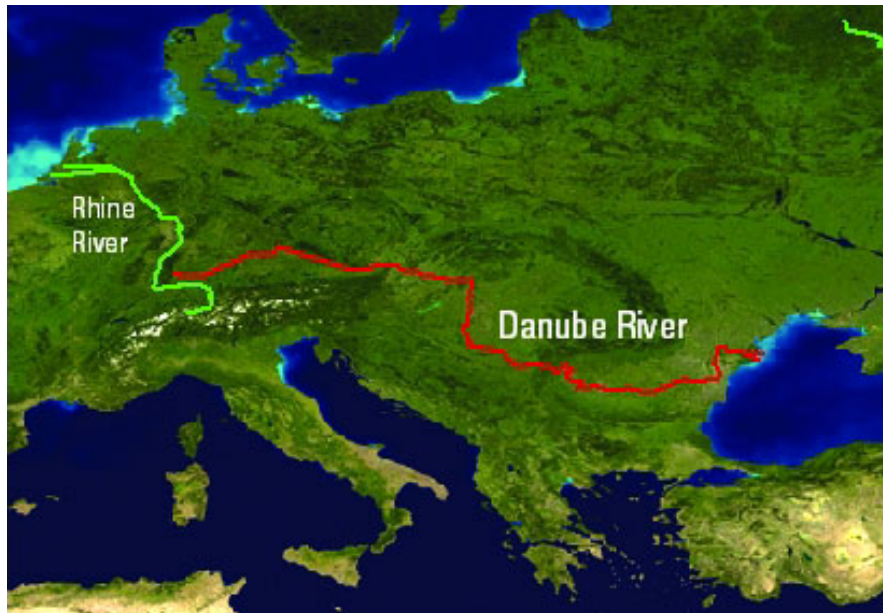
Слика 3. Дунав