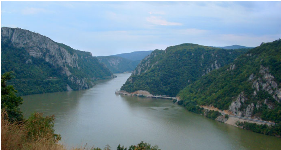
Слика 4. Ђердапско језеро

У Србији се налази већи број језера. Према настанку басена језера се деле на природна и вештачка или антропогена. Природна језера су малобројна, мала по површини. Има их у Војводини и на планинама. У панонској регији налазе се еолска језера која су законом заштићена. Позната еолска језера у Војводини су палићко, Слано, Крваво, Лудошко. Сва су мања осим Палићког. У приобаљу овог језера се налазе угоститељски и туристички објекти.